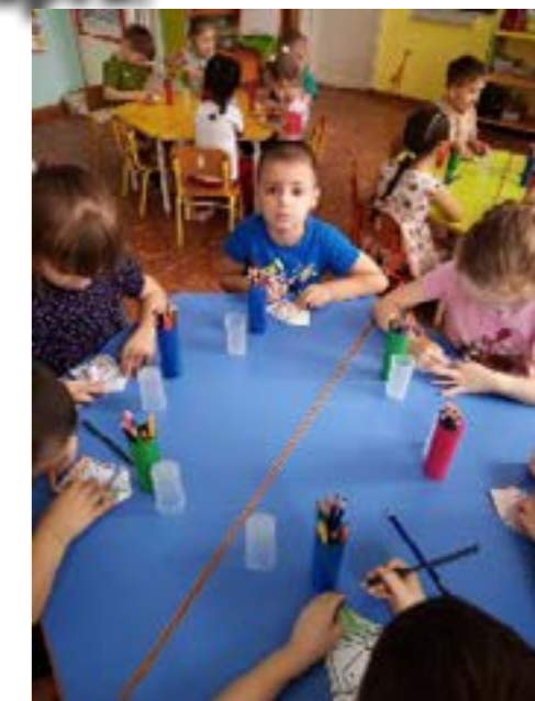
дагогов, и воспитателей.

Весеннее настроение, весёлые детские улыбки зарядили энергией всех участников мастер – класса: и детей, и пе-